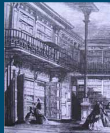
Un rituel ancien, l'ouverture de l'Armoire de fer des Archives nationales à l'Exposition universelle (gravure de Fichot, paru dans L'Illustration , 1867).