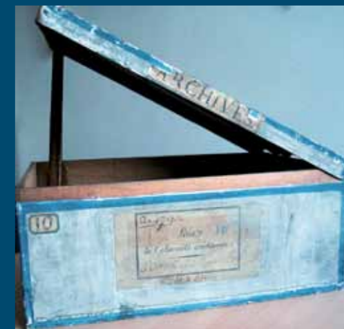
Boîte en chêne de la série A (Lois) des Archives nationales, fabriquée en 1790.