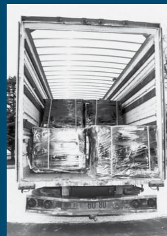
Palettes du premier camion transportant les fonds revenus de Moscou à Fontainebleau en 1994.